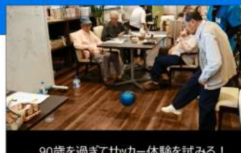
90歳を過ぎてサッカー体験を試みる！