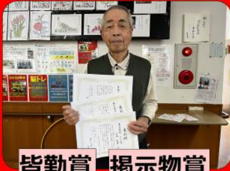
皆勤賞 掲示物賞 要支援保ったで賞