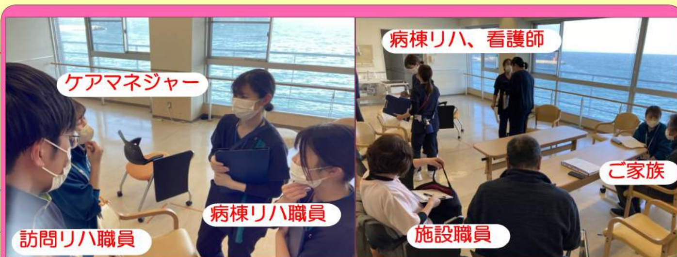
病棟スタッフと在宅スタッフで現状の擦り合わせ！

今後も関係職種と連携しながら、「退院前カンファレンス」への積極的な参加を通じて、ご利用者とご家族が安心して在宅生活へ移行できるよう支援してまいります。