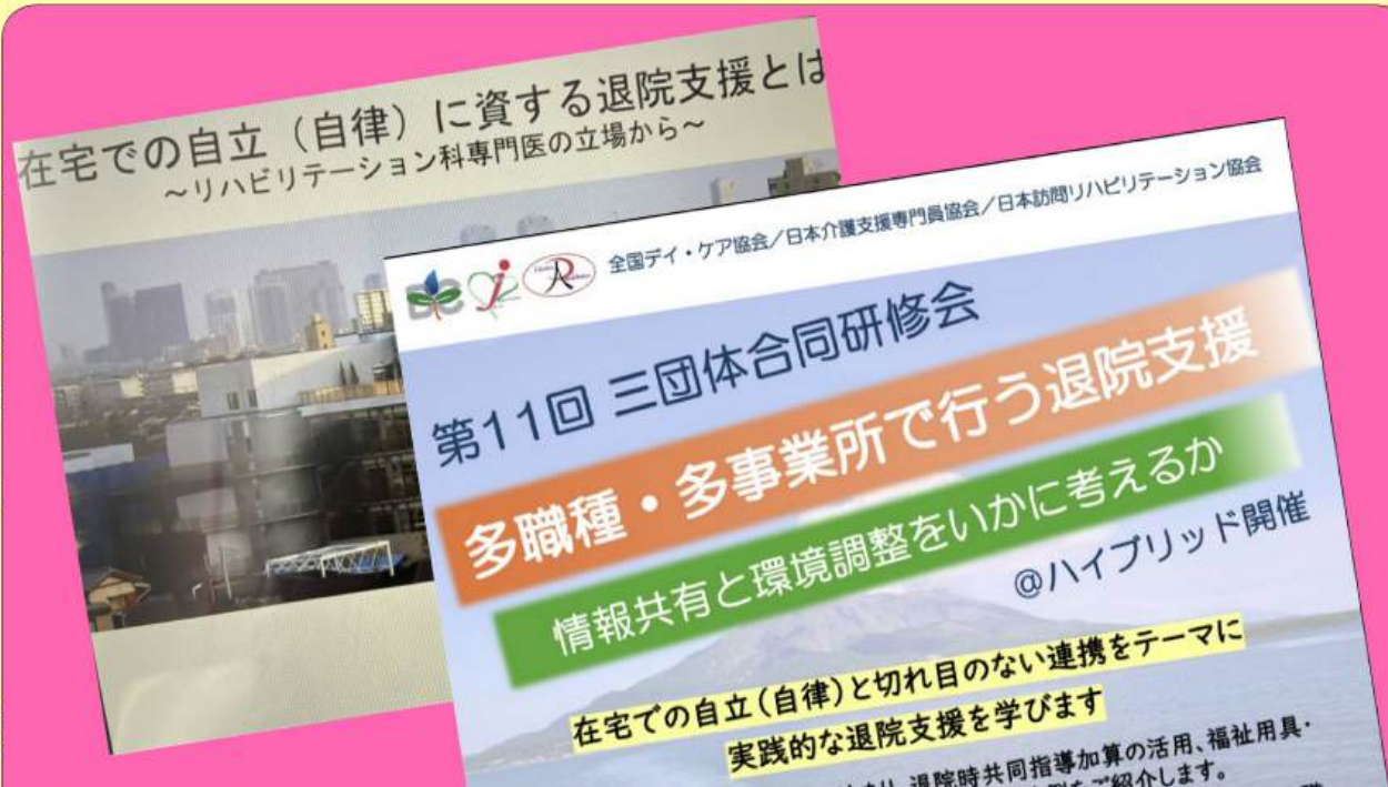
「退院支援」は、医療と在宅の壁を取り払い、それぞれの役割を果たしながら連携する事が大事だと学びました！